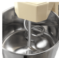
S/S bowl and shaft