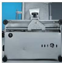
Underside motor protection plate