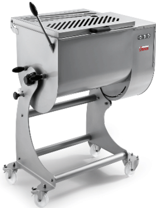
Sirman Фаршемешалки , model IP 50 XP B/a :

Sirman Spa Viale dell'Industria 9/11 35010 PIEVE DI CURTAROLO (PD), Italy Tel./Fax. +39 049 9698666 / +39 049 9698688 email: info@sirman.com