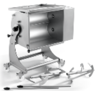
Removable mixing arms