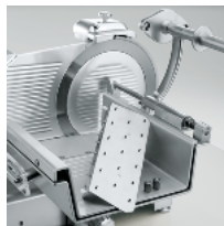
Removable food pusher VCS