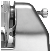
Wide space between blade and motor